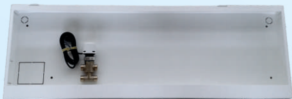
Cassetta di predisposizione posteriore con valvola a 3 vie montata Back case equipped with an installed 3-way valve